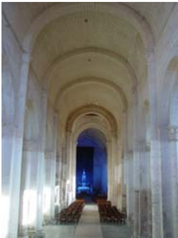
Abbaye de Saint-Amant-de-Boixe