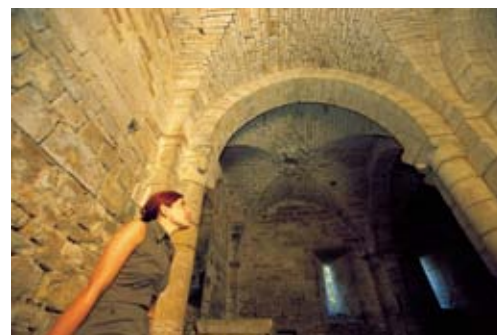
Abbaye de Nanteuil-en-Vallée