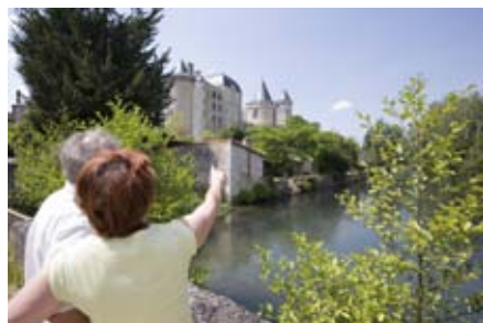
Vue sur le Château de Verteuil-sur-Charente

à Salles-de-Villefagnan 17 h 30 : visite guidée des jardins avec le Club Marpen.