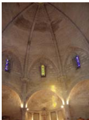
Eglise de St-Michel