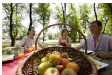
Pique-nique au bord de la Charente