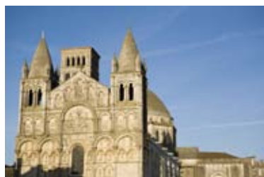
Cathédrale St-Pierre d'Angoulême