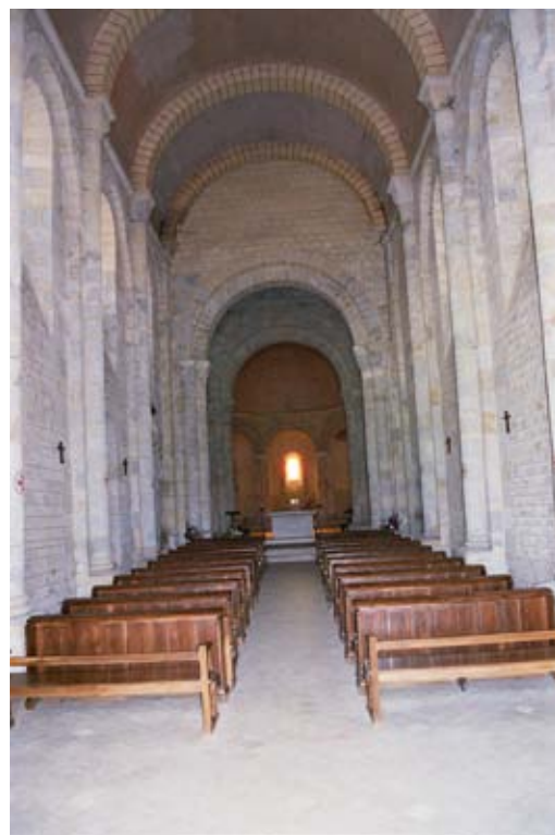
Abbatiale de Aignes-et-Puypéroux

« Seluna » (Cie Arche en sel). Un ballet de feu, une ode à la déesse de la lune, aux chants et mélodies envoûtantes.