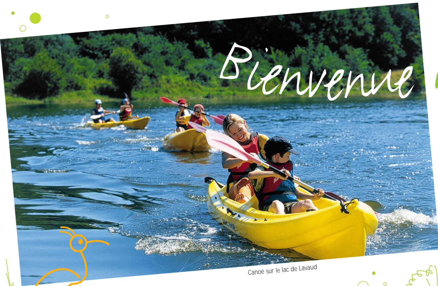
Canoë sur le lac de Lavaud

En Charente Limousine, les lacs de Haute Charente sont le plus vaste espace lacustre de Poitou-Charentes. Bordés de forêts de feuillus, de prairies bocagères, ils sont au cœur du pays que l'on dit de l'eau, l'herbe, l'arbre.